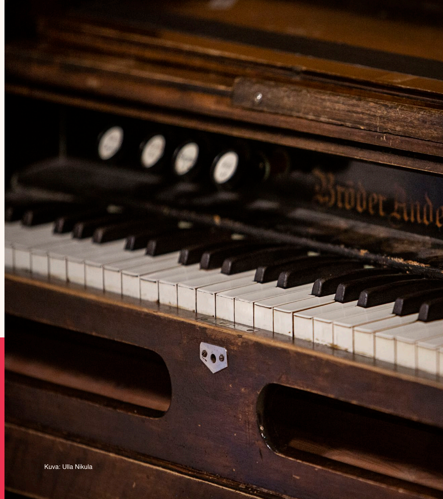
Kuva: Ulla Nikula